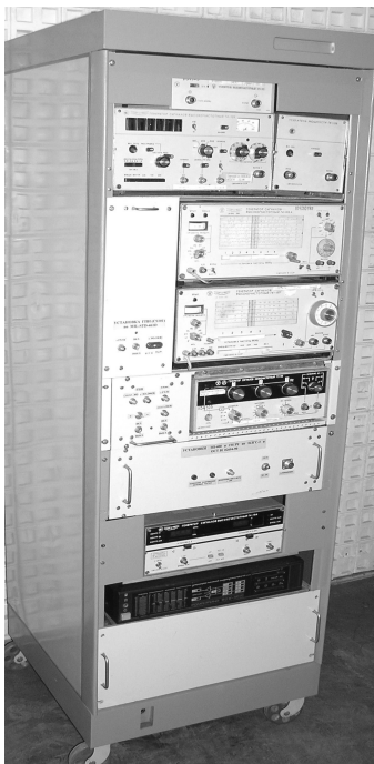
Рис. 1. Общий вид КИ-БОЛА-ЭМС-В