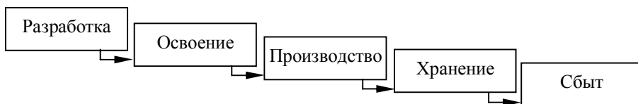
Рис. 2. Этапы жизненного цикла продукции на предприятии-изготовителе

Время возникновения риска невостребованности продукции тесно связано с ее жизненным циклом, поэтому будем его трактовать именно в такой связи. Выделим следующие этапы жизненного цикла продукции (рис. 2).