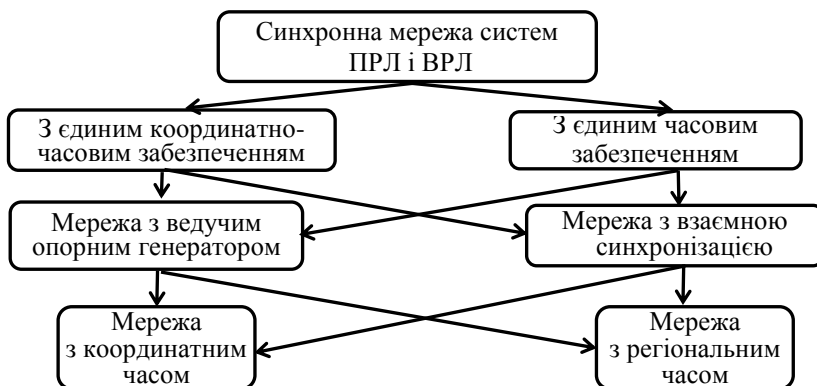
Рис. 2. Класифікація синхронних мереж

Методи забезпечення синхронізму в групі просторово рознесених опорних генераторів часу відрізняються великою різноманітністю. Однак їх можна класифікувати відповідно до використаного алгоритму синхронізації. Класифікація СМ наведена на рис. 2.