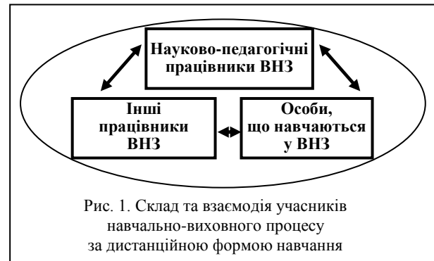
Рис. 1. Склад та взаємодія учасників навчально-виховного процесу за дистанційною формою навчання

Учасниками навчально-виховного процесу, що відбувається за дистанційною формою навчання у вищому навчальному закладі, мають бути педагогічні або науково-педагогічні працівники, інші працівники вищих навчальних закладів та особи, які навчаються (рис. 1) [7].