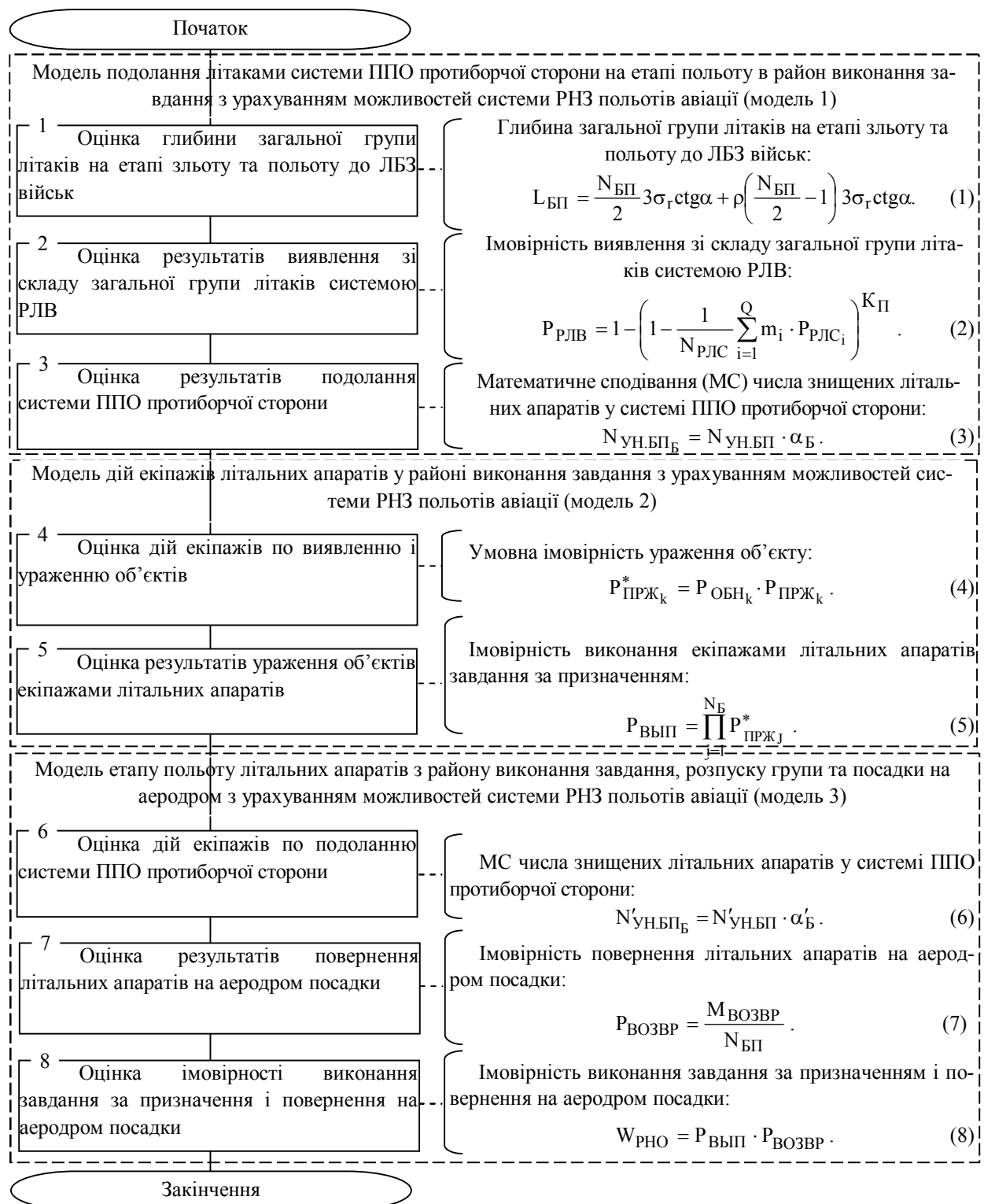
Рис. 1. Блок-схема методики оцінки впливу системи радіонавігаційного забезпечення польотів авіації на результати виконання завдання за призначенням

Наприклад, при виконанні завдання за призначенням, коли: