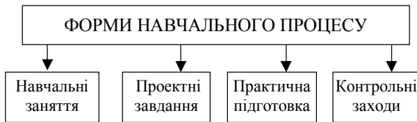
Рис. 1. Основні форми здійснення навчального процесу у ВНЗ

Навчальний процес за дистанційною формою у ВНЗ здійснюється у таких формах: навчальні заняття, виконання проєктних завдань, практична підготовка, контрольні заходи (рис. 1) [2].