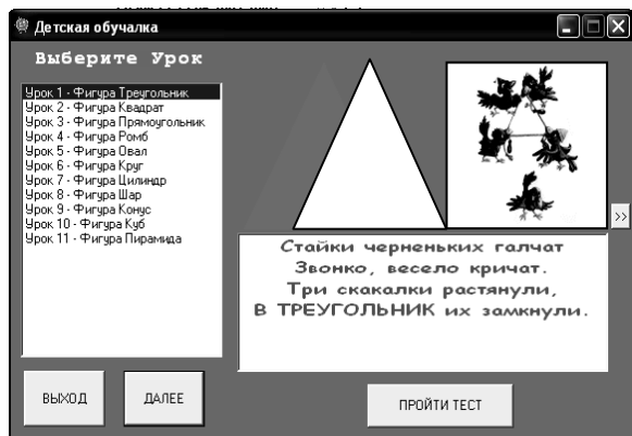
Рис. 2. Главное диалоговое окно с вложенными окнами

– окно с изображением выбранной изучаемой фигуры;