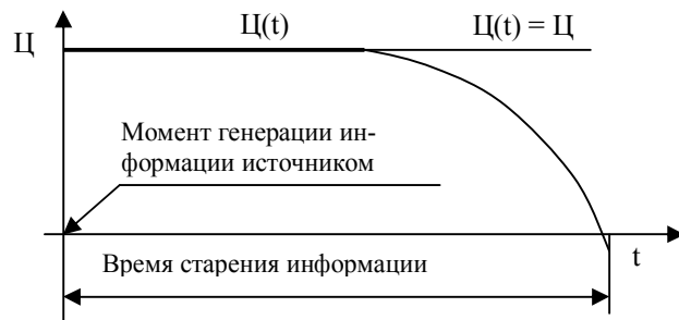
Рис. 1. Изменение во времени характеристик ценности и старения информации

Существуют разные точки зрения относительно таких понятий, как ценность и старение информации. Так, например, в [1] старение информации определяется как закон изменения ценности информации во времени, рис. 1.