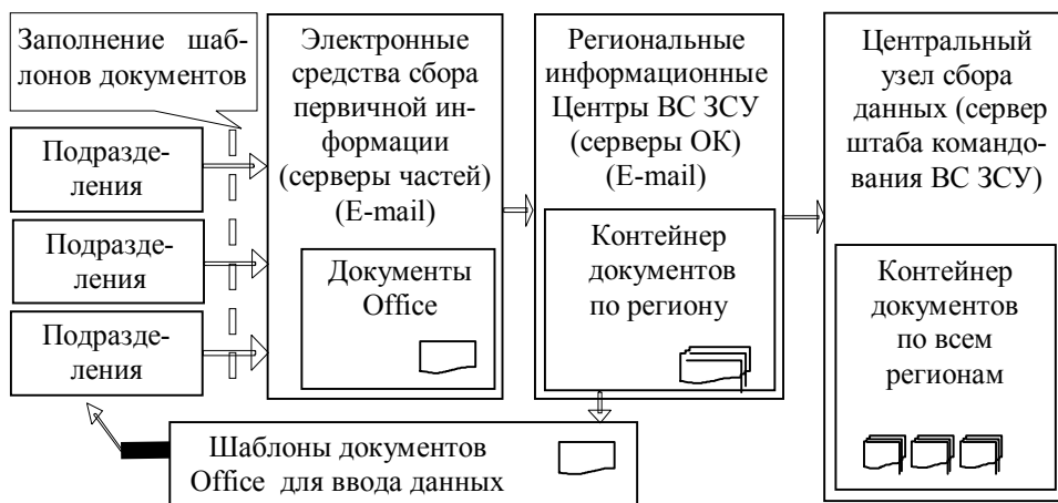
Рис. 3. Схема сбора первичной информации о техническом состоянии, режимах и результатах эксплуатации образцов ЗР(РТ)В

Информационное обеспечение ИАС НТС должно быть распределено по уровням заказчиков работ, участников НТС и источников первичной информации. При этом сбор данных о техническом состоянии и результатах эксплуатации ЗР(РТ)В является необходимым условием достижения целей функционирования ИАС НТС. Порядок сбора первичных данных представлен в виде схемы на рис. 3