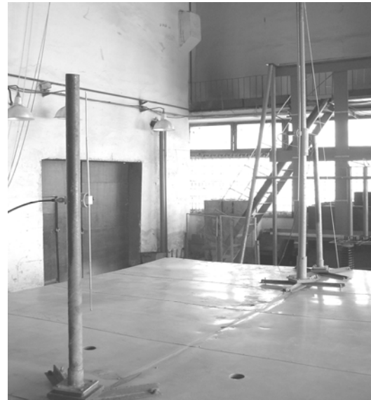
Рис. 2. Рабочее место при проведении проверки затухания ОИП с антеннами DP-1 (вертикальная поляризация)

3) на частоте измерений 30 МГц (генератор Г4-107, который изображен на рис. 3 (справа)) при подсоединенных к антеннам штатных кабелей подстраивают выходной уровень генератора сигналов так, чтобы получить устойчивый отсчет на измерительном приемнике, не искаженный внешними помехами и его собственными шумами;