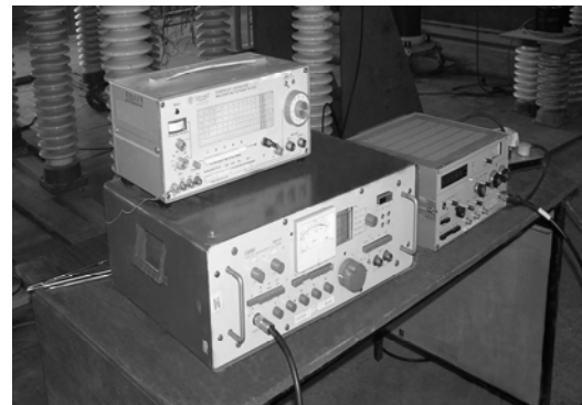
Рис. 3. Оборудование для аттестации ОИП.

4) изменяют высоту установки приемной антенны в пределах от 1 м до 4 м;