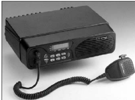
Рис. 2. Зовнішній вигляд багатоцільової радіостанції HF-SSB

На озброєння армії НАТО прийнята короткохвильова радіостанція MOTOROLA MICOM – 2 (рис. 2), яка є багатоцільовою радіостанцією, що розроблена для використання в стаціонарних та мобільних варіантах. Вона забезпечує передавання голосу, факсу та даних на великих відстанях. Особливістю цієї радіостанції є те, що вона побудована із використанням технології цифрової обробки сигналів на основі цифрових сигнальних процесорів.