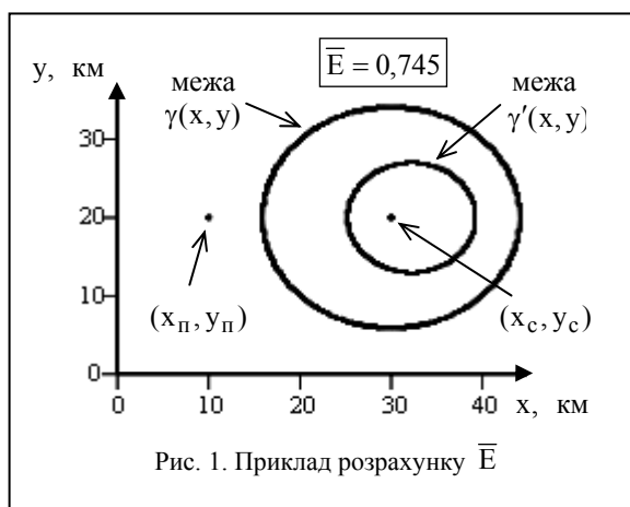
Рис. 1. Приклад розрахунку \bar{E}

Keywords: radiocommunication system, radiojamming efficiency, uncertainty of co-ordinates.