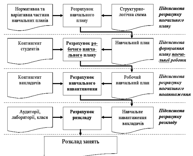
Рис. 2. Функціональна структура системи управління навчальним навантаженням

2. Підсистема формування плану навчальної роботи. Автоматичне проектування робочих навчальних планів у відповідності з нормативами міністерства освіти і науки України та бажаним обсягом середнього навантаження на викладачів.