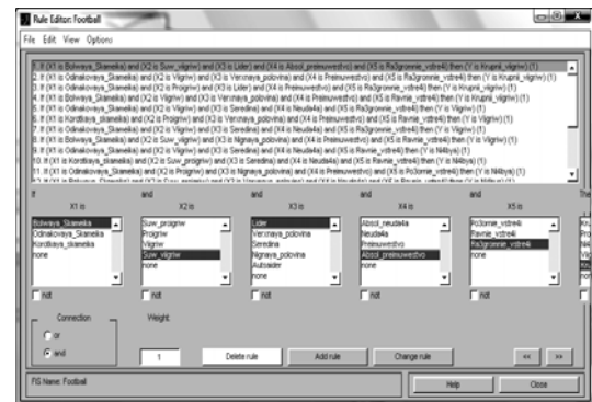
Рис. 3. Создание базы знаний