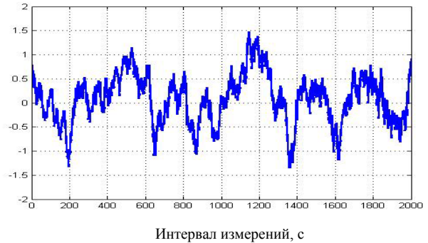
Рис. 3. Изменение вида и периода синусоидального сигнала. Станция EVPT, 24 декабря, спутник №10

Сложный сигнал на входе в приемник может быть представлен следующим выражением: