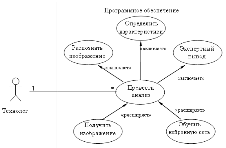
Рис. 1. Модель использования

Это следует из более детального анализа самого процесса, что позволяет выделить в качестве отдельных сервисов такие действия, как распознавание изображения, определение характеристик по распознанному изображению и генерирование экспертного вывода об исследуемом образце. Указанные действия раскрывают поведение исходного варианта использования в смысле его конкретизации, и поэтому между ними будет иметь место отношение включения.