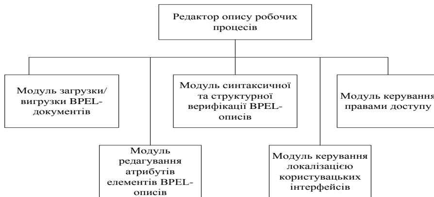
Рис. 2. Основні архітектурні блоки редактора описів робочих процесів