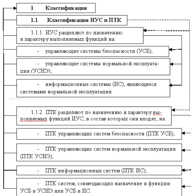
Рис. 1. Фрагмент текста и результат анализа его иерархической структуры

На рис.1 приведен в качестве примера фрагмент текста (НП 306.5.02/3.035-2000. Требования по ядерной и радиационной безопасности к информационным и управляющим системам, важным для безопасности атомных станций) и результат анализа его иерархической структуры.