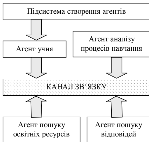
Рис. 1. Архітектура багатоагентної системи для дистанційного навчання

Архітектура багатоагентної системи дистанційного навчання представлена на рис. 1.