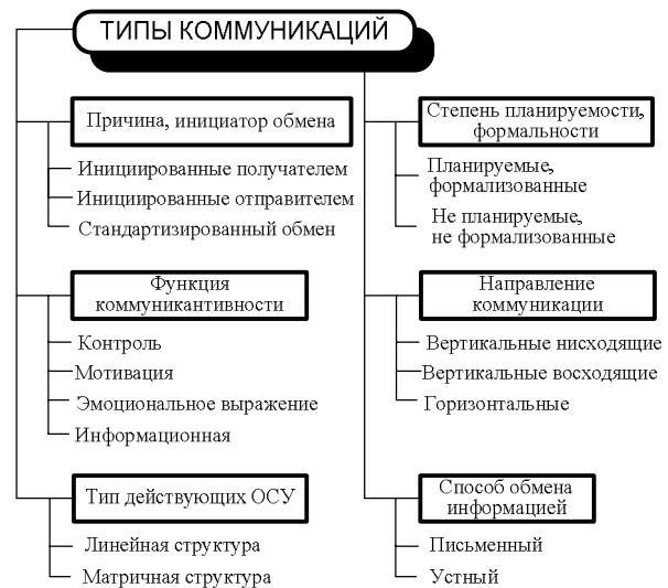
Рис. 1. Классификация типов коммуникаций

2. По основной функции процесса коммуникации в группе исполнителей или организации в целом [6]: