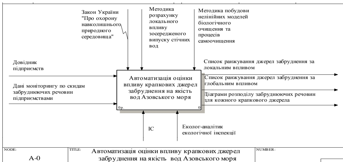
Рис. 1. Контексна діаграма

Концепція побудови модуля автоматизації розроблена за допомогою інструменту BPWin 4.0 у вигляді контексної діаграми (рис. 1) та першого рівня декомпозиції (рис. 2).