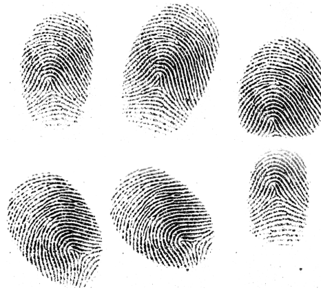
Рис. 2. Пример различных положений отпечатка пальца при сканировании

Использование такого метода позволяет получать достаточно большое количество вариантов сравнений, необходимых для построения характеристик при несопоставимо меньших количествах отпечатков пальцев в тестовой базе.