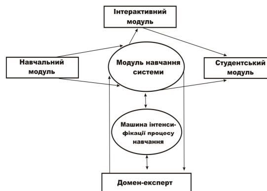
Рис. 1. Структура інтелектуальної навчальної системи

Розроблена нами адаптивна інтелектуальна система складається із шести взаємозв'язаних модулів (рис. 1) [1].