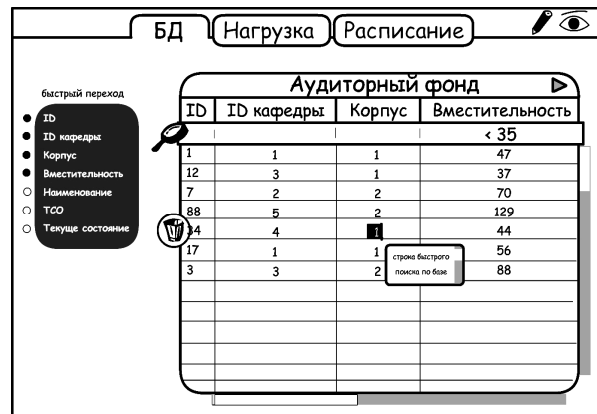
Рис. 4. Модель модуля программы составления учебного расписания

В рамках решения поставленной задачи необходимо создание такой модели данных, при которой объем вспомогательной информации был бы минимальным, существовала принципиальная возможность многопользовательского доступа к данным и был бы обеспечен высокий уровень защиты данных (рис. 4).