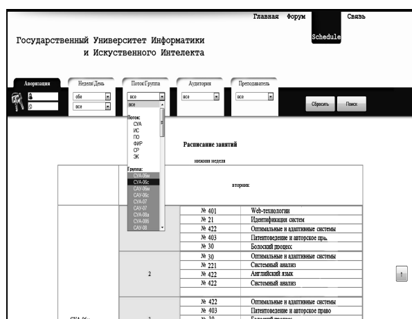
Рис. 2. Экранная форма пользовательского блока программы

Каждый модуль программы отвечает за выполнение определенного набора функций. Ядром системы является БД Расписание. За вход в систему отвечает блок аутентификации. Он позволит работать диспетчеру даже в доме. С помощью модуля отката диспетчер может отменять предыдущие установки программы, что является немаловажным. Модули отображения позволяют представить информацию в удобочитаемом виде. Для диспетчера и для пользователя эти модули будут отличаться.