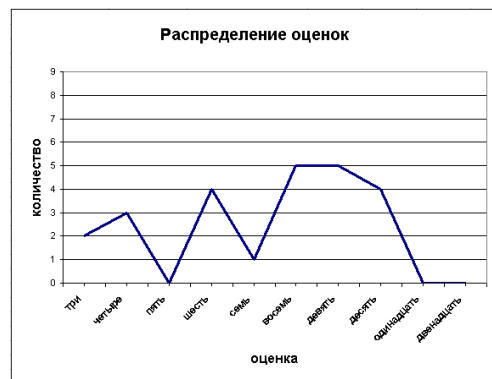
Рис. 2. Распределение оценок после предложенной формы организации занятий

Для того, чтобы убедиться в пользе проведения курса «Выравнивающий курс по информатике», в конце семестра было проведено тестирование студентов с использованием тех же тестов, что и в самом начале семестра. Результаты второго тестирования приведены на рис. 2.