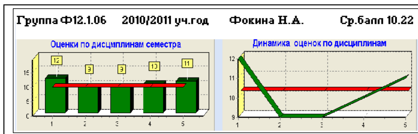
Рис. 4. Динамика оценок по дисциплинам семестра