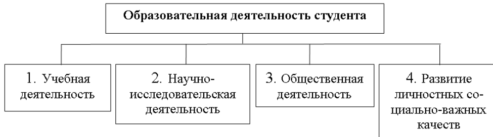
Рис. 1. Структура ИРС «Студент»

данных и формирование частных (промежуточных) и итоговых результатов выполняет третий модуль системы (рис. 2). Приводятся фрагменты вывода результатов в различных форматах (табличных и графических) и оценочные характеристики апробации ИРС (рис. 3). Для вывода результатов в нестандартных форматах нужен еще один модуль, который в настоящее время разрабатывается.