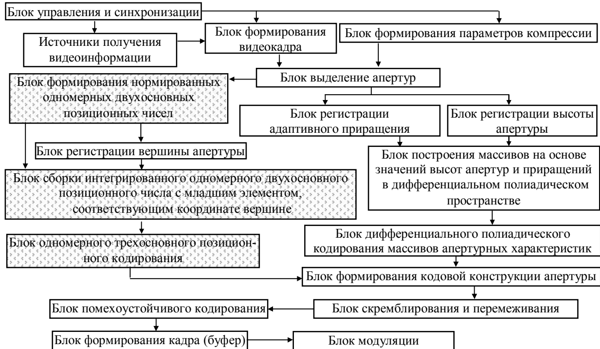
Рис. 1. Способ верификации разработанного кодера в системе компрессии изображений

Значит, восстановление величины x_{\xi, \gamma} как элемента ОТОПЧ должно производиться в условиях отсутствия информации о весовых коэффициентах элементов обрабатываемого числа. Отсюда предлагается рассматривать координату вершины апертуры как последний младший элемент ОТОПЧ (рис. 1).