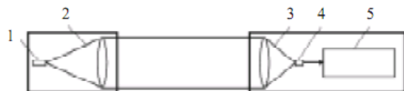
Рис. 3. Функціональна схема лазерної системи виміру (контролю) габаритів об'єктів (порушників):

вплив зовнішнього засвічування. Номінал навантажувального резистору фотодіоду обирається невеликим для того, щоб сигнал не входив у насичення при влученні сонячного випромінювання в приймач.