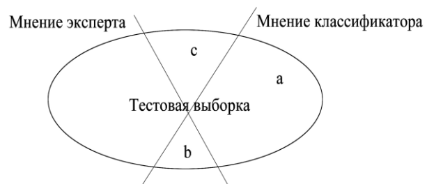
Рис. 1. Соотношение экспертной оценки и оценки классификатора

Для количественной оценки полноты и точности рубрикатора используются следующие измерения: a – число правильно рубрированных документов, b – число неправильно рубрированных документов, c – число неправильно отвергнутых документов. Под правильной и неправильной рубриацией понимается случай, когда классификатор приписывает анализируемый документ некоторой рубрике, что расценивается некоторым экспертом соответственно, как верное и неверное решение. Под неправильным отвержением документа понимается случай, когда классификатор не приписывает документ рубрике, что, по мнению эксперта, неверно. На рис. 1 представлена иллюстрация этих случаев.