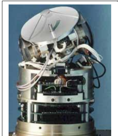
Рис. 2. Головка самонаведення протирадіолокаційної ракети

Таким чином, знаючи параметри \lambda=0,1 м (РЛС 19Ж6), d=0,25 м (ППР HARM), можна розрахувати: ширина ДС антенної системи ППР буде становити 20...30 град. Для більшості методів наведення