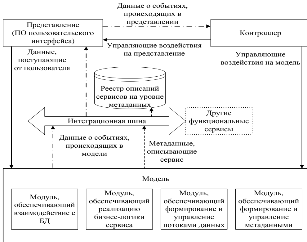
Рис. 2. Схема взаимосвязей основных компонентов фреймворка функционального сервиса

где L_{Sem} – обозначение семантического представления функционального сервиса как совокупности знаний (метаданных) о структуре и содержании отдельных компонентов этого сервиса; L_{DB} – обозначение представления функционального сервиса на уровне хранимых данных; L_{DF} – обозначение представления функционального сервиса на уровне потоков данных; L_{BL} – обозначение представления функционального сервиса на уровне программной реализации бизнес-логики; F_{L_{DB}}^{L_{Sem}} – функтор, устанавливающий отображение семантического представления функционального сервиса в представление на уровне хранимых данных; F_{L_{DF}}^{L_{DB}} – функтор, устанавливающий отображение представления функционального сервиса на уровне хранимых данных в представление на уровне потоков данных; F_{L_{BL}}^{L_{DF}} – функтор, устанавливающий отображение представления функционального сервиса на уровне потоков данных в представление на уровне программной реализации бизнес-логики; F_{L_{DF}}^{L_{BL}} – функтор, устанавливающий отображение представления функционального сервиса на уровне программной реализации бизнес-логики в представление на уровне потоков данных; F_{L_{DB}}^{L_{DF}} – функтор, устанавливающий отображение представления функцио-