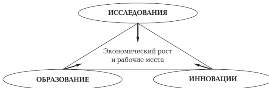
Рис. 1. Лиссабонская стратегия

Все три составляющие, представленные в Лиссабонской стратегии (рис. 1) – образование, исследования и инновации, лежат в сфере деятельности современных университетов.