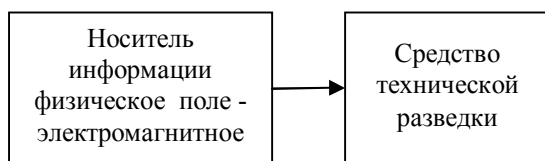
Рис. 2. Структурная схема технического канала утечки информации, при осуществлении радиосвязи между объектами в космосе

С точки зрения физики можно утверждать, что информация в данном случае переносится только носителем информации - электромагнитным полем. Пустота (вакуум) физической среды никакого участия в процессе передачи информации абсолютно не принимает и схема ТКУИ обретает новый вид, приведенный на рис. 2.