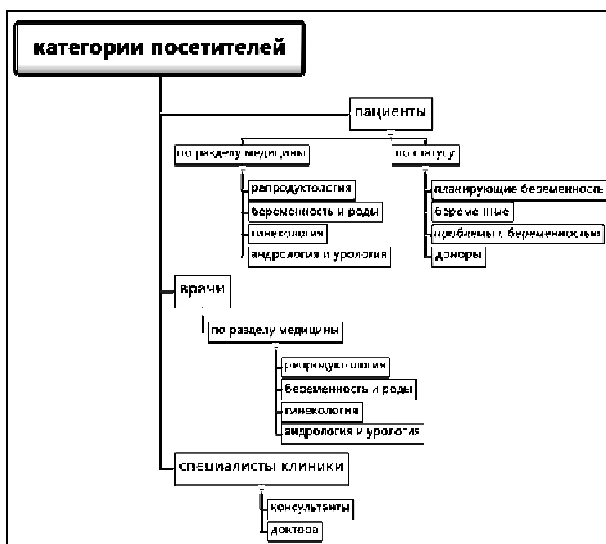
Рис. 3. Категории посетителей медицинского сайта