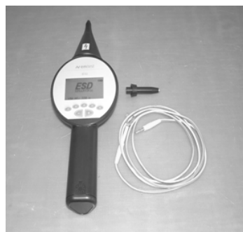
Рис. 1. Загальний вид генератора електростатичних розрядів фірми DITO