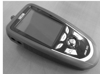
Рис. 7. Вимірювач температури, вологості та тиску „АМІ 300/МНТР”

Але, важливо, якщо порівняльні результати знаходяться у різних секторах, щоб результати випробувань за використання генератору з негативним коефіцієнтом дестабілізуючої дії знаходились на шкалі ліворуч від результатів випробувань за використання генератору з позитивним коефіцієнтом дестабілізуючої дії. Якщо це не так, то слід шукати причини невідповідності.