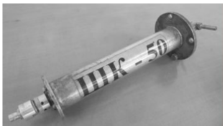
Рис. 6. Шунт вимірювальний коаксіальний ШК-50 для вимірювання імпульсів вихідних струмів генераторів Г-МІЗ

Таким чином, на етапі 3, який пов'язаний з порівнянням результатів випробувань несприйнятливості до дії завади обраного зразку обладнання (одного, або декілька однакових зразків), має бути враховане визначений коефіцієнт дестабілізуючої дії K_d .