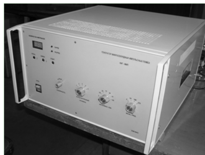
Рис. 3. Загальний вид комбінованого генератора мікросекундних імпульсних завод Г-МИП-6

Для визначення вихідних параметрів генераторів Координатор використовує комплект засобів вимірювальної техніки (ЗВТ), складові якого представлено в табл. 1.