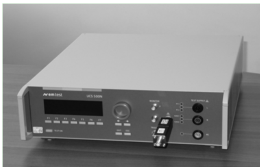
Рис. 2. Загальний вид генератора швидких перехідних процесів/пакетів імпульсів UCS 500N5

Для визначення вихідних параметрів генераторів Координатор використовує комплект засобів вимірювальної техніки (ЗВТ), складові якого представлено в табл. 1.