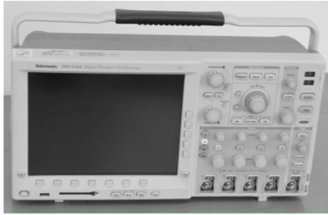
Рис. 4. Осцилограф ТЕКТРОНІХ DPO 4104 для вимірювання імпульсів вихідних струмів ЕСП та МІЗ, та імпульсів вихідної напруги НІЗ та МІЗ

За результатами визначення вихідних параметрів генераторів кожний зразок ідентифікується коефіцієнтом дестабілізуючої дії. Для процесів, які розглядаються, пропонується цей коефіцієнт ( K_d ) розраховувати за формулою: K_d = (P_r - P_c) / P_c , де P_c – максимальне значення похідної на фронті імпульсу напруги (струму) для стандартизованого імпульсу; P_r – відповідна похідна для генератору, який досліджується.