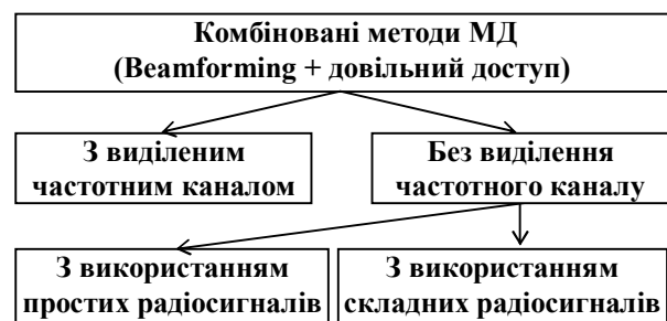
Рис. 2. Класифікація комбінованих методів МД

Загальну класифікацію комбінованих методів МД на основі просторового та випадкового наведено на рис. 2.