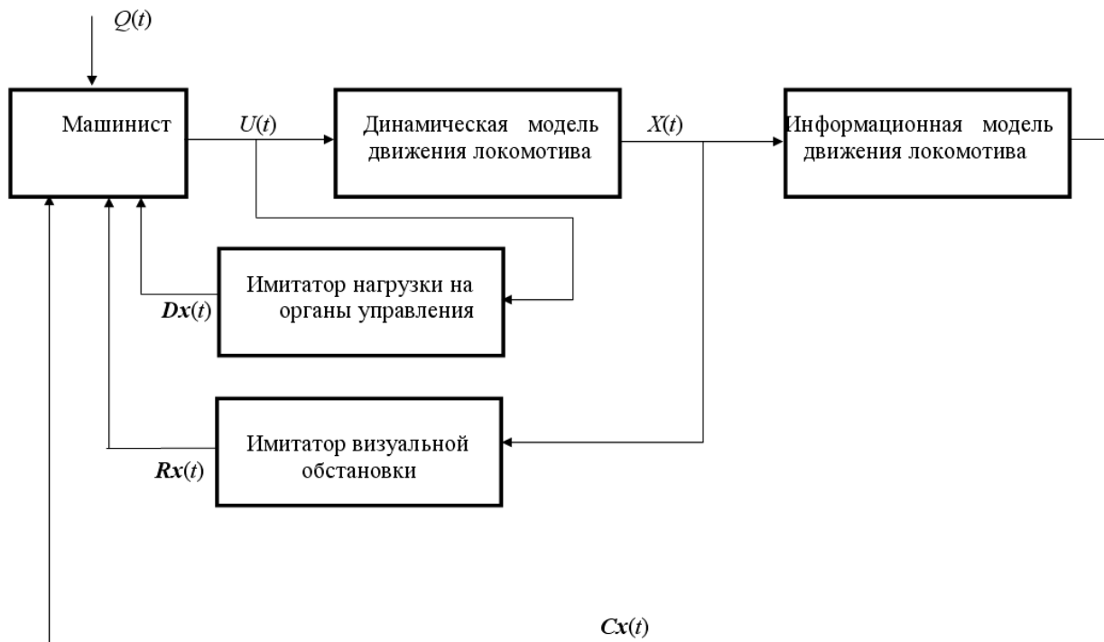
Рис. 2. Структурная схема включения имитатора визуальной обстановки

В тренажёре, все показания приборов и изменение внешнего вида за окном макета кабины локомотива должны изменяться с запозданием не более 120 мсек – это требование режима реального времени, так же как и в тренажёрах летательных аппаратов [2]. В тренажёре подготовки машиниста локомотива на обучаемого воздействуют информационные потоки, сформированные за интервал \Delta t , от имитаторов формирующих инструментальную информа-