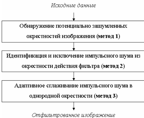
Рис. 2. Основная спецификация обобщенного унифицированного метода фильтрации импульсного шума изображений

Обобщенный унифицированный метод фильтрации импульсного шума изображений, представленный на рис. 1, в своей основной спецификации представляется в следующем виде (рис. 2).