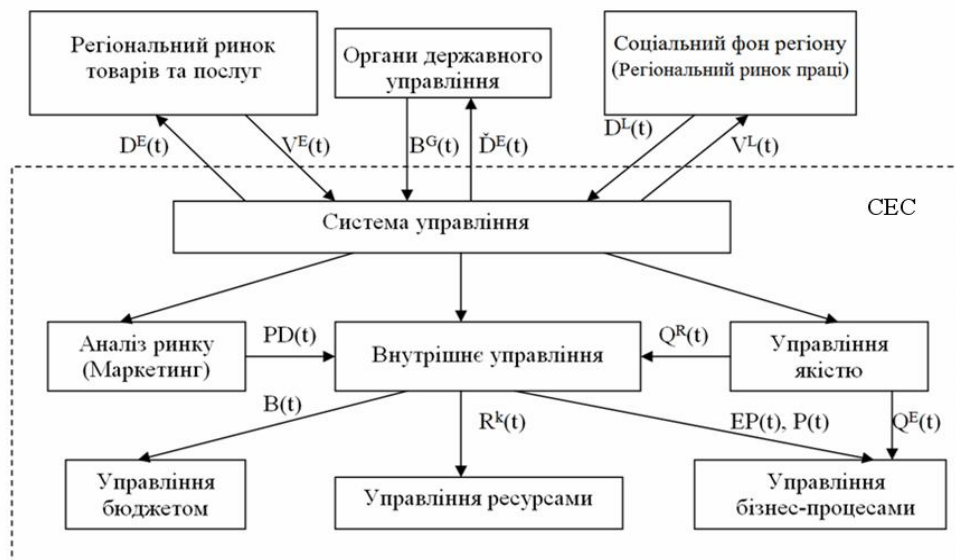
Рис. 1. Структурна модель СЕС як об'єкта управління

Інформація про зовнішнє середовище, спільно з інформацією про внутрішню структуру, використовується для побудови загальної моделі системи управління. Структурна модель об'єкта управління наведена на рис. 1.