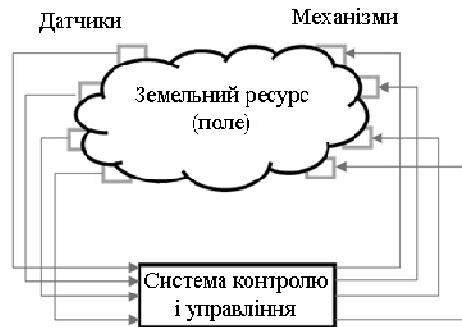
Рис. 5. Взаємодія інформаційної технології з полем

механізмів диференційного внесення добрив, точно го висіву та зрошення. Таким чином, земельний ресурс є об'єктом керування для інформаційної технології.