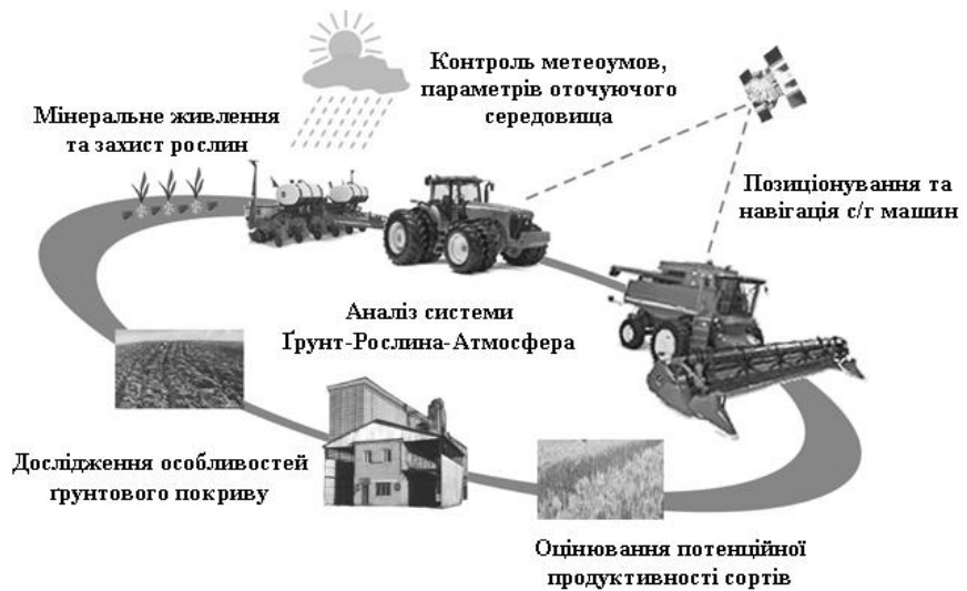
Рис. 2. Цикл завдань точного землеробства

Третій рівень – прикладний, який доцільно розділити на дві компоненти: інструментальну і предметну. Інструментальна компонента визначає шляхи та засоби реалізації інформаційних технологій, які можна розділити на методичні, інформаційні, математич-