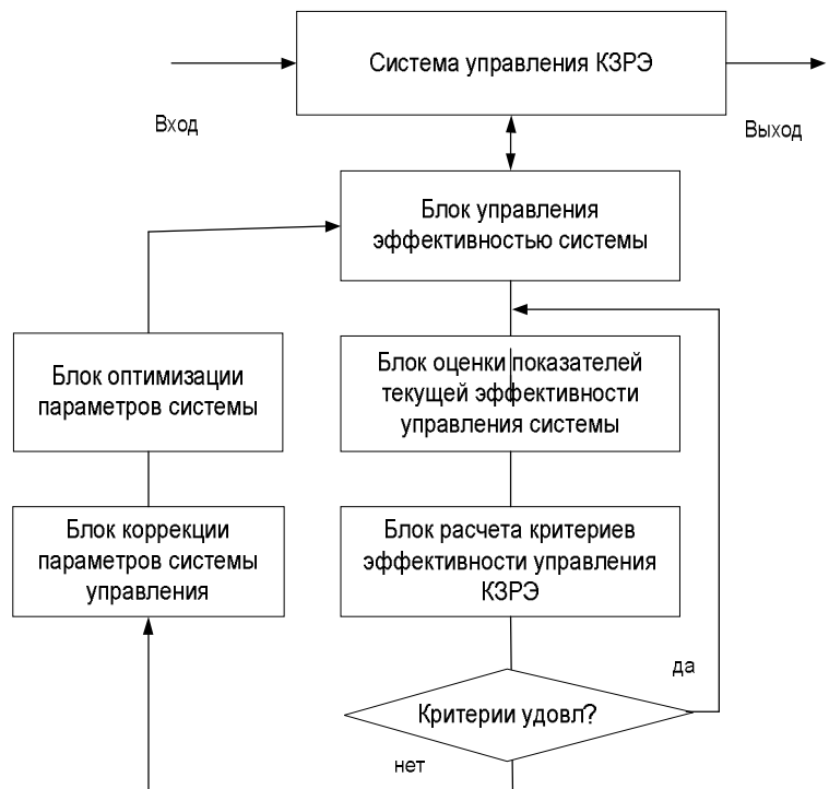
Рис. 1. Блок-схема концептуальной модели компьютеризированной адаптивной системы управления КЗРЭ

a_i, a_j – типы внутренних факторов и среды,