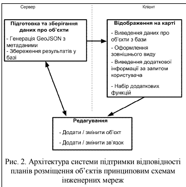
Рис. 2. Архітектура системи підтримки відповідності планів розміщення об'єктів принципівим схемам інженерних мереж

геометричні фігури: Point, LineString, Polygon, MultiPoint, MultiLineString, MultiPolygon і GeometryCollection. Особливість в GeoJSON описує об'єкт геометрії і його додаткові властивості, а колекція особливостей є списком особливостей.