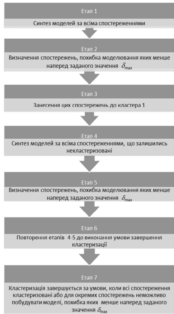
Рис. 1. Алгоритм кластеризації

кластеризацію спостережень МВД необхідно проводити за результатами їх моделювання. Створений алгоритм кластеризації (рис. 1) використаний під час модельного експерименту підтвердив гіпотезу про доцільність кластеризації спостережень масиву вхідних даних за результатами їх моделювання. Отримані послідовності спостережень, що характеризуються спільними механізмами впливовості факторів та дозволили синтезувати точні, адекватні та структурно стійкі моделі. Похибка моделювання при цьому зменшилася в середньому на 96% [8, 9].