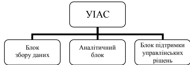
Рис. 1. Структура УІАС як інформаційно-аналітичної системи

прийняття рішень на основі сучасних методів просторового аналізу, моделювання розвитку надзвичайних ситуацій і прогнозування їх наслідків [7]. Виходячи з функцій що виконуються, УІАС НС можна представити у вигляді трьох блоків: блоку збору даних, аналітичного блоку та блоку підтримки управлінських рішень, рис. 1.