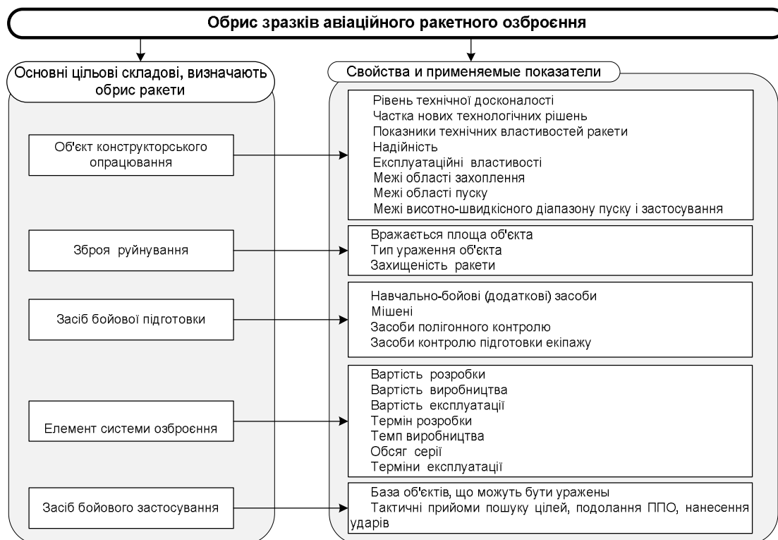
Рис. 3. Основні компоненти обрису авіаційного ракетного озброєння

Авіаційне ракетне озброєння розробляється, експлуатується не само по собі, не самостійно, а в складі групи відповідних засобів, тобто у складі авіаційного комплексу, будучи одним з основних системоутворюючих його елементів. Технічним обрисом авіаційного ракетного озброєння, їх типажем, кількістю (пропорціями в загальній сукупності засобів) визначається склад авіаційних комплексів в угрупованні, який залежить від номенклатури і кількості наявного авіаційного ракетного озброєння, що,