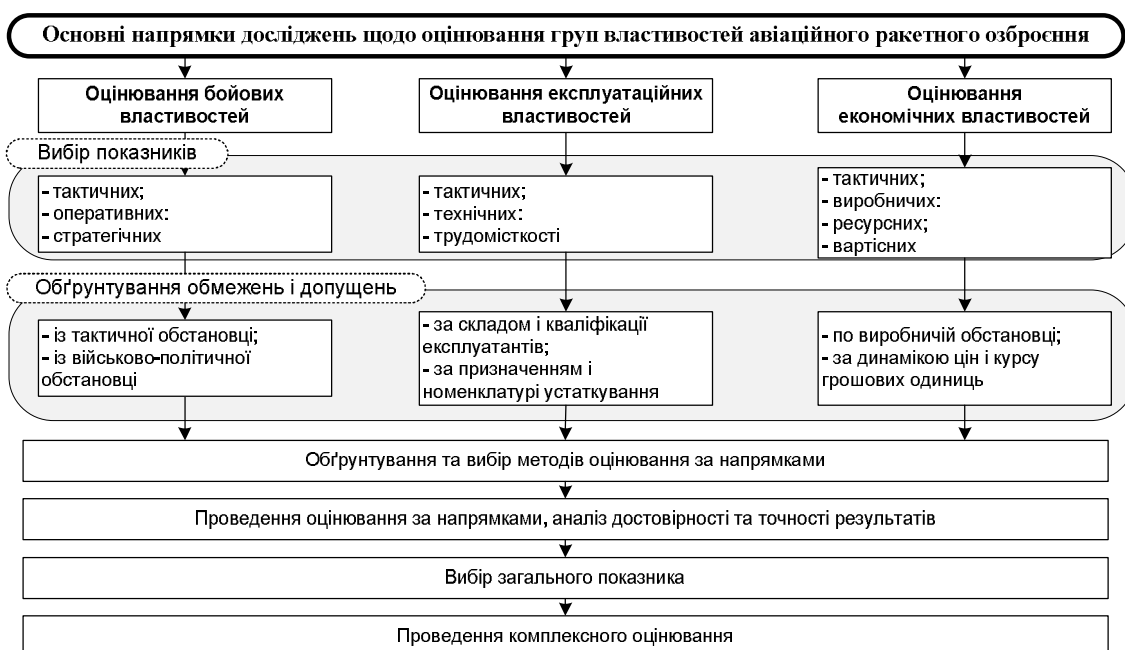
Рис. 2. Схема оцінювання властивостей зразка авіаційного ракетного озброєння при формуванні його технічного обрису