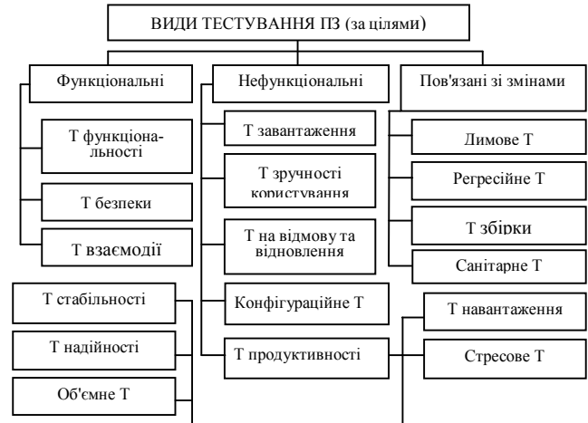
Рис. 1. Класифікація видів тестування за цілями

вання за ступенем ізольованості компонентів, яке характеризує також рівень тестування програмного продукту. Для модульного тестування характерним є здійснення перевірки мінімально можливого для тестування компоненту (наприклад, окремого класу або функції) самим розробником ПЗ. При інтеграційному ж тестуються інтерфейси між компонентами, підсистемами або системами. За наявності резерву часу на даній стадії тестування ведеться ітераційно, з поступовим підключенням подальших підсистем.