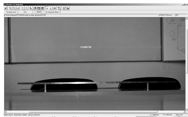
Рис. 2. Измерение объекта в другой плоскости калибровки (1000 мм)