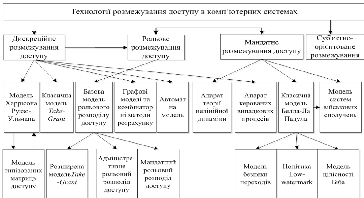
Рис. 1. Класифікація базових технологій розмежування доступу до ресурсів комп'ютерних систем

З метою вибору напрямку подальшого дослідження проведемо порівняльний аналіз базових технологій розмежування доступу до ресурсів комп'ютерних систем, що представлені на рис. 1.