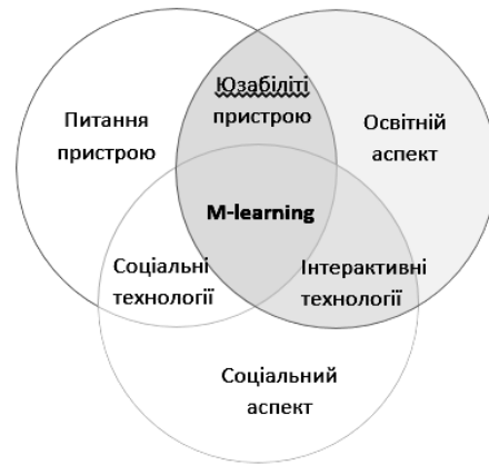
Рис. 1. Аспекти, на яких засноване мобільне навчання