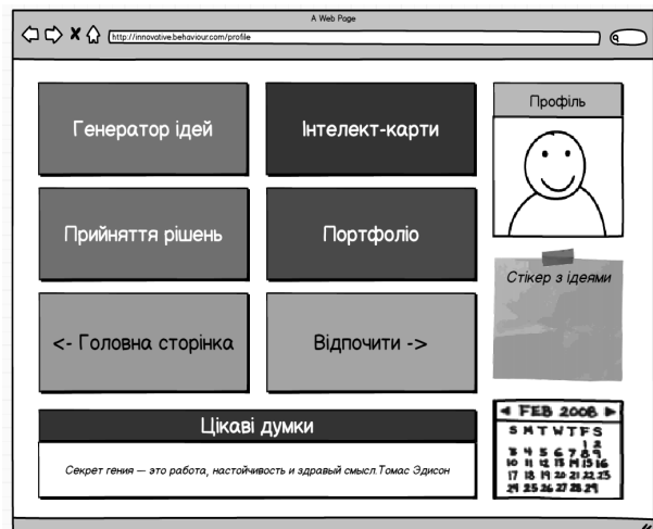
Рис. 3. Макет сторінки «Творчість»